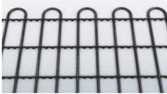
Slika br. 1: Primer montiranog grejnog kabla pomoću plastičnih distancera

drže distancu između linija grejnog kabla. Linije grejnog kabla se ne smeju dodirivati ni u jednoj tački i potrebno je pravilnom montažom obezbediti da se linije grejnog kabla nikad ne dodirnu. To je važno, jer u suprotnom može doći do pregrevanja kabla i njegovog kvara.